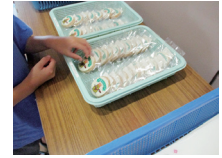
【オリジナルクッキー】

加していきたいし、一票を大切に経験を生かす。今回の経験を生かして社会に参加し、一票を大切に経験を生かす。今回の経験を生かして社会に参加し、一票を大切に経験を生かす。